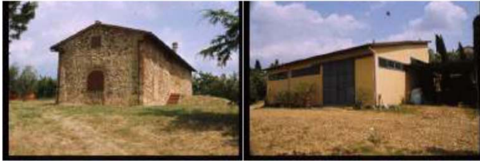
Foto effettuate durante il sopralluogo eseguito il 14/07/2020